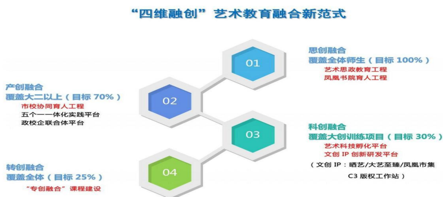
图1 “思维融创”艺术教育融合新范式

学校通过完善专创融合知识架构和量化评价，促进教学过程与内容、教学方法和手段的融合，促进专业教师成长为双创教育主体，挖掘和充实了艺术专业课程双创教育资源，链接了实践教学、学科竞赛、众创空间和文化科技创意园，形成双创教育实践体系和双创成果转化整合体系。